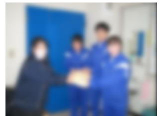
11/28 赤い羽根共同募金