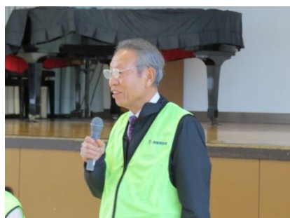
人権擁護委員の方のお話

「今日のお話を聞いて、人権は一人ひとりが個性を持って、自由に平等に生きるためにとても大切なものと分かりました。また、花の植栽をしたことで、命が育まれる過程や、それを守る大切さに気づくことができました。これからは、相手を思いやる言動を心掛け、周りの人を大切にしていきたいと思います。今日はありがとうございました。」