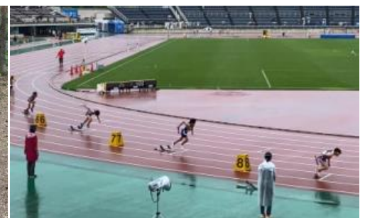
6年: リレーのスタート！