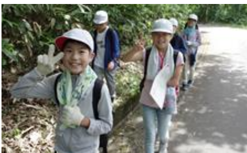
4年: 山頂めざしががんばります！

＜5年生＞宿泊学習の野外炊飯は、雨で薪が水分を含み、なかなか火がつかず苦労しました。2日目のプロジェクトアドベンチャーは、友達と考えを出し合い、楽しみながら取り組むことができました。