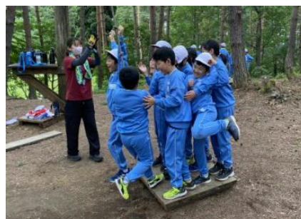
5年: やったあ！課題クリア