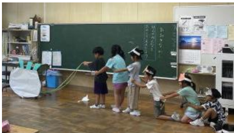
1年: 大きなながぶは抜けるかな？

＜3年生＞地域の素材を生かした学習に取り組みました。1学期のまとめとして、自分たちがパワーアップしたところを話し合いながらふり返り、2学期に生かそうとしていました。