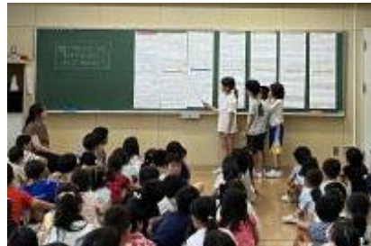
2年: 見つけたことを発表