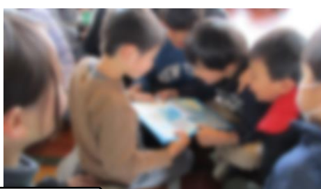
今までありがとう