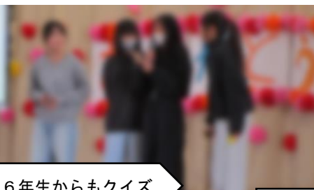
6年生からもクイズ