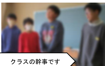
クラスの幹事です

からは十小の先輩方に続き、後輩や地域のために、さまざまな活動を積極的に行っていきたい」と力強くあいさつしました。その後、各クラスの幹事が紹介されました。卒業生のみなさんには、これからは十小の同窓生として、後輩たちを温かく見守りながら、地域の中でそれぞれの力を発揮し、